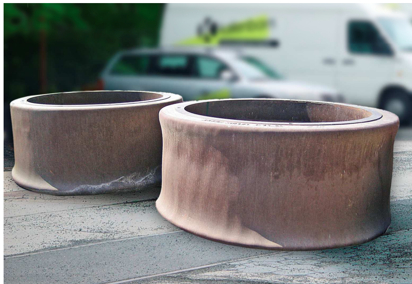
L'usure des galets de broyage dans les broyeurs verticaux est importante ; ici des galets de broyage de farine crue usés avant leur remise en état