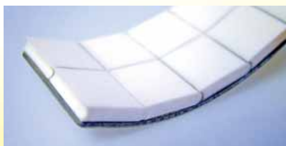
Assemblage par languette/rainure