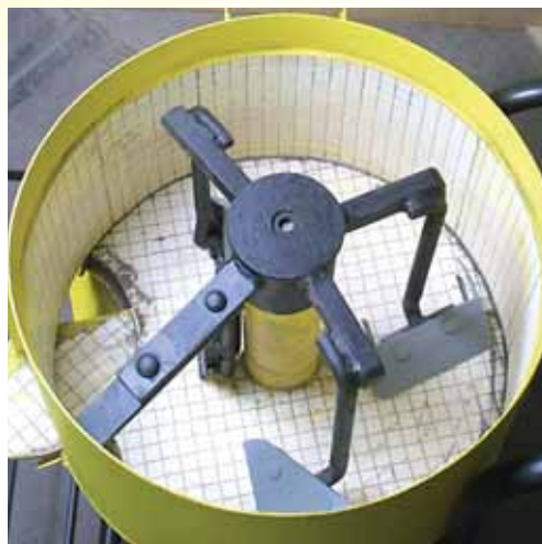
Revêtement contre l'usure d'un malaxeur, les mosaïques de céramique d'alumine s'adaptent parfaitement à ses formes géométriques

La mosaïque KALOCER peut également être fournie équipée d'une sous-couche vulcanisée en caoutchouc sous la désignation KERAFLEX. L'épaisseur de cette sous-couche dépend du degré de sollicitations aux chocs et aux bruits auxquels sera soumis le KERAFLEX.