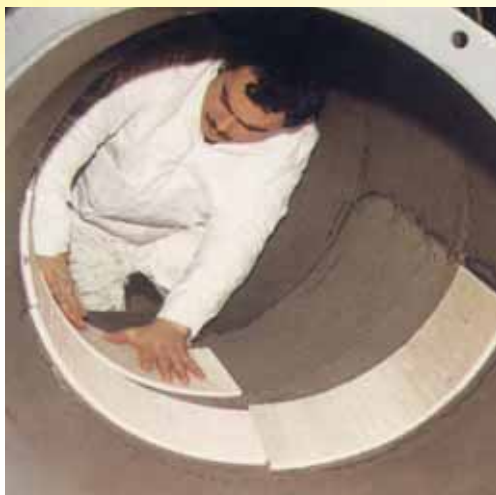
Revêtement d'une gaine de dépoussiérage de clinker en mosaïque KALOCER épaisseur 6 mm posée avec une résine époxy KALFIX