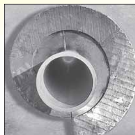
Förderschnecken geschützt mit KALMETALL-W 100, Durchmesser bis 2 000 mm, Länge bis 10 000 mm