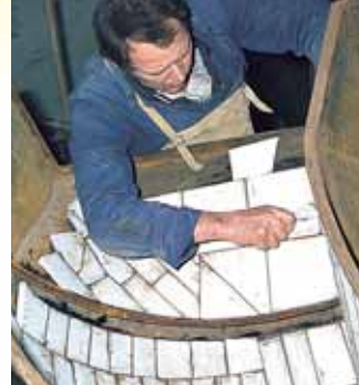
Rutschen mit KALCERAM Auskleidung sind eine dauerhafte Lösung, z.B. für Sackverladeanlagen in Zementwerken