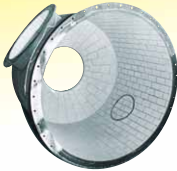
Auch konische Flächen lassen sich durch geschnittene KALCERAM Platten anforderungsgerecht auskleiden